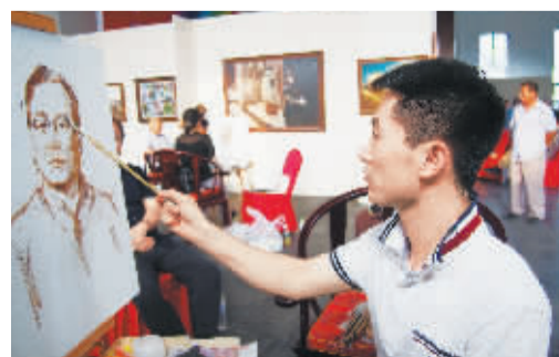
朝鲜艺术家现场作画