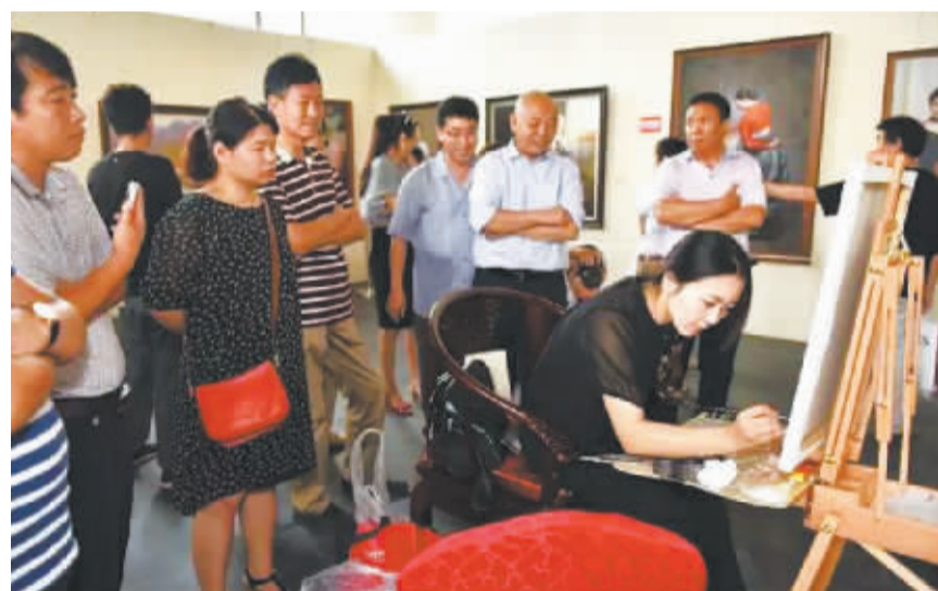
朝鲜艺术家的精彩创作吸引观众驻足