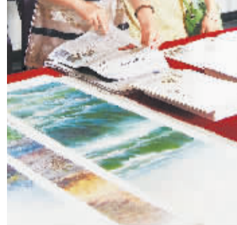
观众浏览展览相关报道